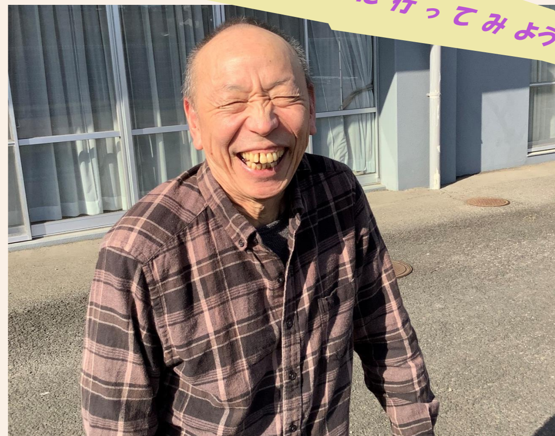
令和2年度フォトコンテスト優秀賞